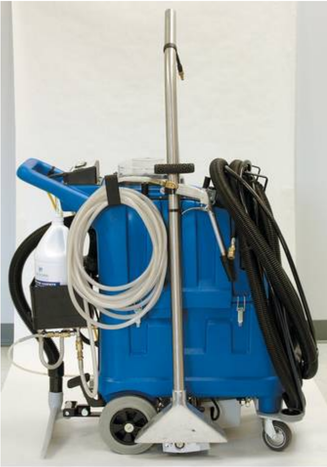
Avec ensemble smart