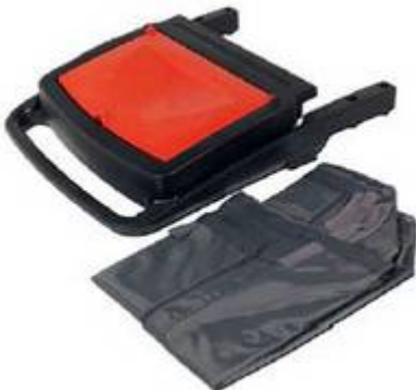
Kit de sac supplémentaire avec sac en tissu