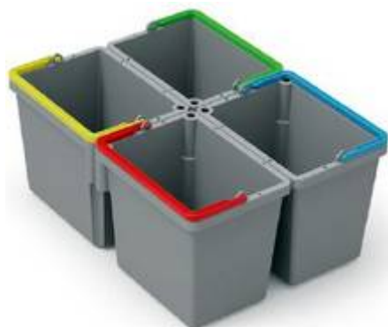
Seau 4 x 5L

Poignées en option : rouge/bleu/vert/jaune