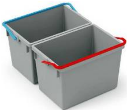
Seaux pivotants Seau 2 x 10L Bacs de rangement verrouillables