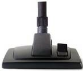
601729 Outil combiné