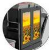
Panneaux de porte personnalisables