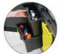
Tiroir de rangement