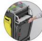
Installation discrètement des déchets