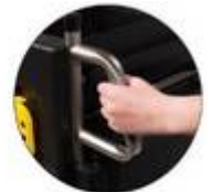
Construit pour durer