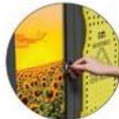
Entreposage sûr et sécurisé

La technologie ReFlo utilise la meilleure qualité de plastique recyclé