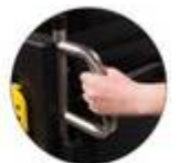
Construit pour durer