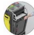
Installation discrètement des déchets