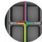
Codage de couleurs pour l'industrie