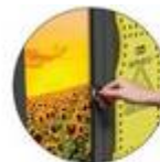
Entreposage sûr et sécurisé

La technologie ReFlo utilise la meilleure qualité de plastique recyclé