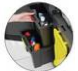
Tiroir de rangement