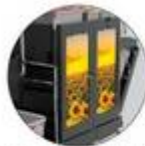
Panneaux de porte personnalisables