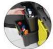
Tiroir de rangement