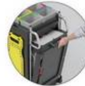
Installation discrètement des déchets