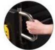
Construit pour durer