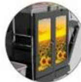
Panneaux de porte personnalisables