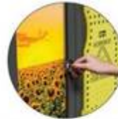
Entreposage sûr et sécurisé

La technologie ReFlo utilise la meilleure qualité de plastique recyclé